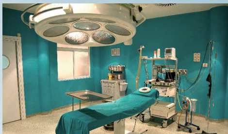
衛生管理の施された手術室がある