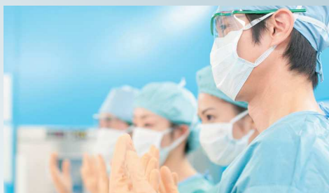
チーム医療による感染予防の徹底