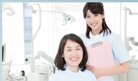
充実したケア・保証が備わっている

昨今、説明会や相談窓口へ問い合わせが増えている トラブルに関するご質問 も わかりやすくご説明いたします。