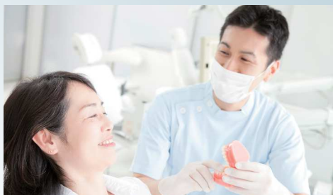
十分なカウンセリングと説明がある