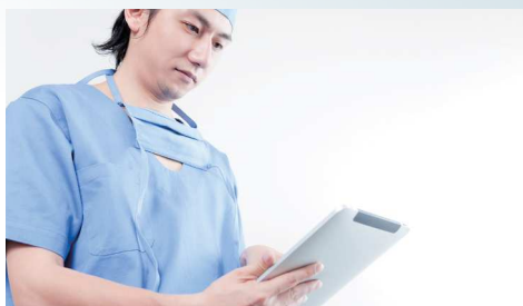
全身管理担当医が手術に参加している